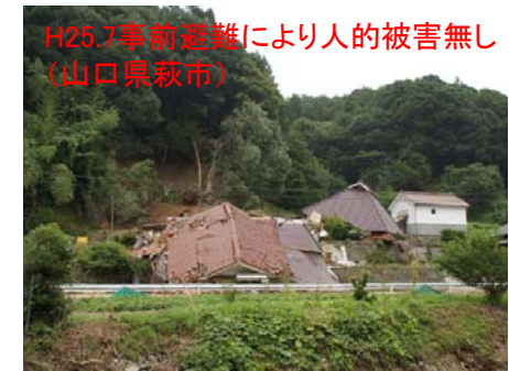
H25.7事前避難により人的被害無し (山口県萩市)