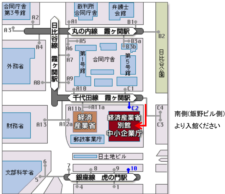
地図: 経済産業省別館