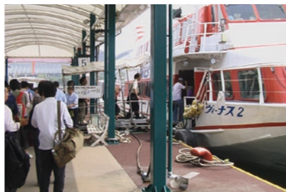
離島をむすぶフェリー

ほどう じ でんしゃ どうろ つく ○歩道や自転車道を作 たり、LRT(次世代型路面 電車)を走らせたり、快適で べん り 便利な都市・地域の交通体 系を整備を進めています。