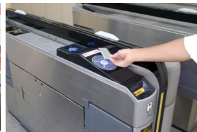
バスにも鉄道にも乗車できる乗り継ぎに便利な「ICカード乗車券」

じんこう げんじょう こうらい すす ○人口の減少や高齢化が進んでいる地域 を守るため、地方の鉄道・バス路線、旅客船 などの地域の交通が元気をとりもどすよ うな取り組みを進めています。