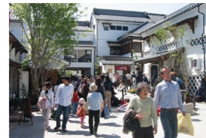
にぎわいのあるまちづくり

しょうてんがい ○商店街のにぎやかさをとりもどし、お としま 年寄りをめめたあらゆる人にとって暮 らしやすいまちづくり、地域の歴史・文 か し ぜん かん ぎょう 化・自然環境などの特性を活かした個 せい 性あふれるまちづくりを進めています。