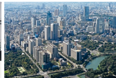
都市環境づくりに取り組む霞ヶ関地区

とし まちやう しぜん まも ○都市の貴重な自然を守り、河川を生き かえ 返らせる取り組みやヒートアイランド現 しょう 象、地球温暖化防止のための公園など りょく 緑地の整備を進めています。