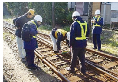
線路の安全をチェックする国土交通省の職員