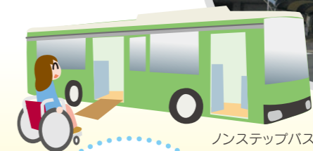
ノンステップバス