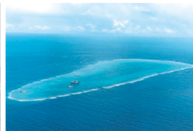
日本の領土で最も南に位置する「沖ノ島島」