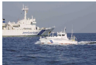
海上保安庁の測量船

備、不審船や密輸・密航の取り締まり、離島の保全などの取り組みを総合的に進めています。