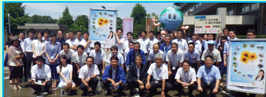
夏の日差しが降り注ぐなか、多くの方に参加していただきました！ 打ち水後、会場には、涼しい風が吹き抜けました！ 水の大切さについて、改めて考えてみてはいかがでしょうか？