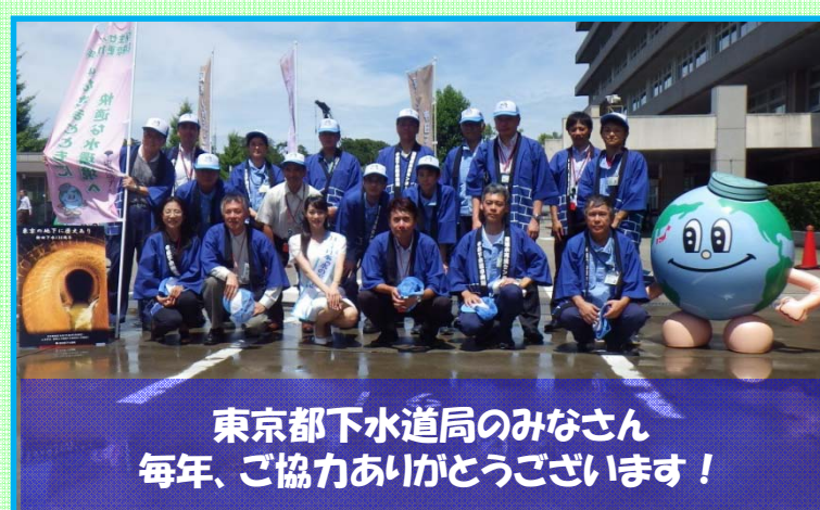
東京都下水道局のみなさん 毎年、ご協力ありがとうございます！