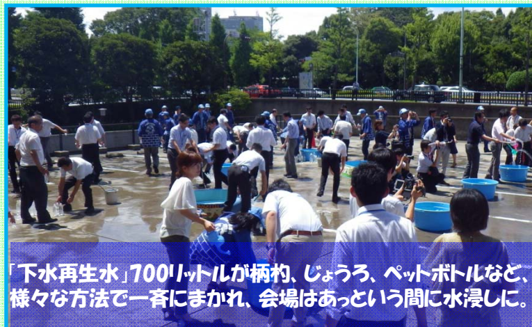
「下水再生水」700リットルが柄杓、じょうろ、ペットボトルなど、 様々な方法で一斉にまかれ、会場はあっという間に水浸しに。