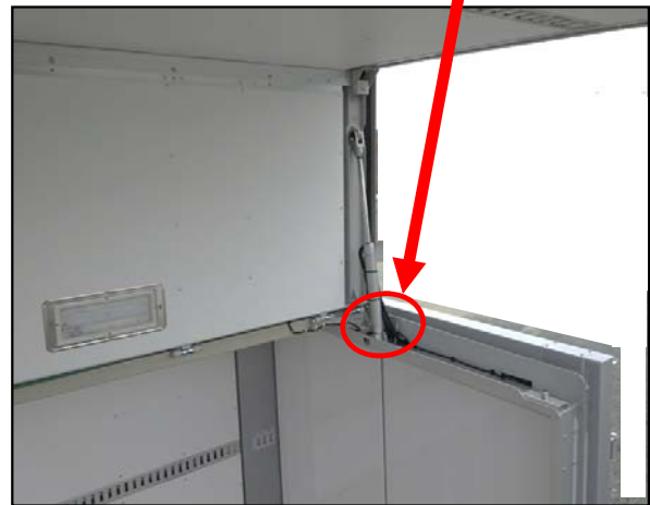
【不具合発生箇所の詳細】