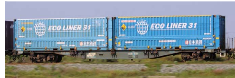
31フィートコンテナの例