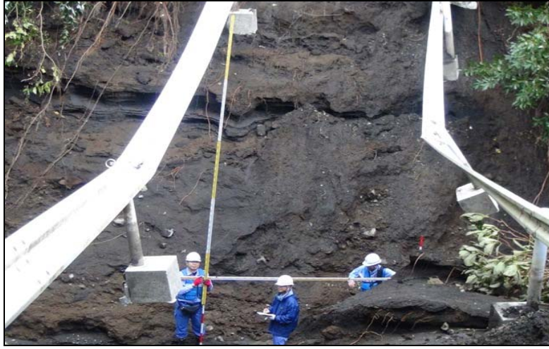
写真－3 道路崩壊箇所調査