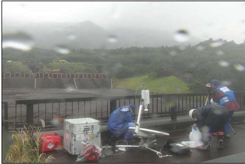
写真－4 台風接近中での監視カメラ設置作業