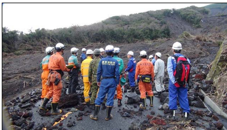
写真-2 行方不明者搜索箇所の安全確認