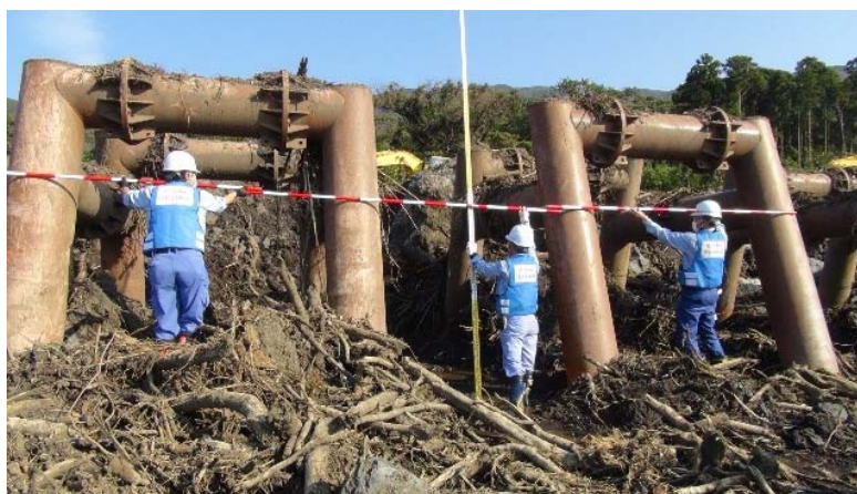
写真-1 砂防施設の流木堆積状況調査