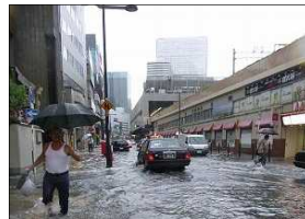
平成25年8月大阪市梅田駅周辺での浸水