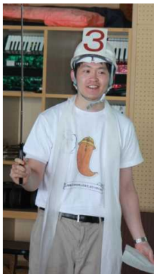
探検隊が子供たちを 全力でサポート！

職員自ら「ウンディー探検隊」となって、子供たちと一緒に楽しく下水道や水・資源の循環について学習！さあ、黄金のキラキラうんちを目指して探検隊と冒険しよう！