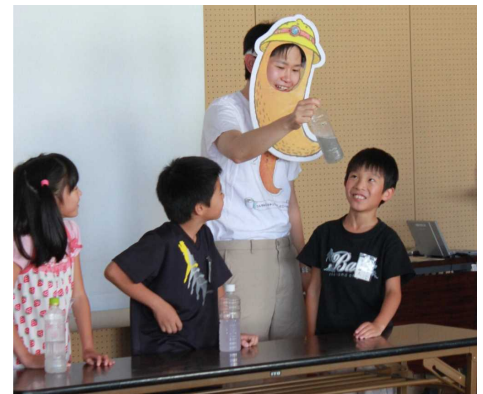
溶け比べ実験！ どの紙が溶けたかな？