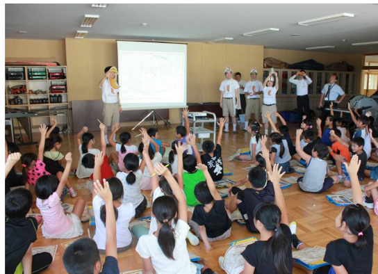
子供たちも積極的に参加