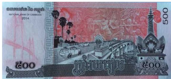
新500リエル札 (左:つばさ橋、右:きずな橋(ともに日本のODA))