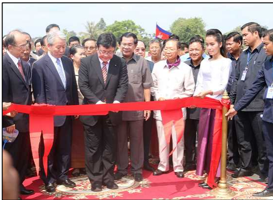
「つばさ橋」テープカット