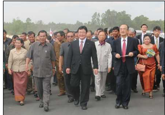
橋を歩く、フン・セン首相(左)、西村副大臣(中)、隈丸大使(右)