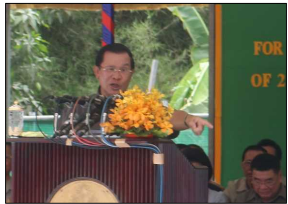
式典でのフン・セン首相挨拶