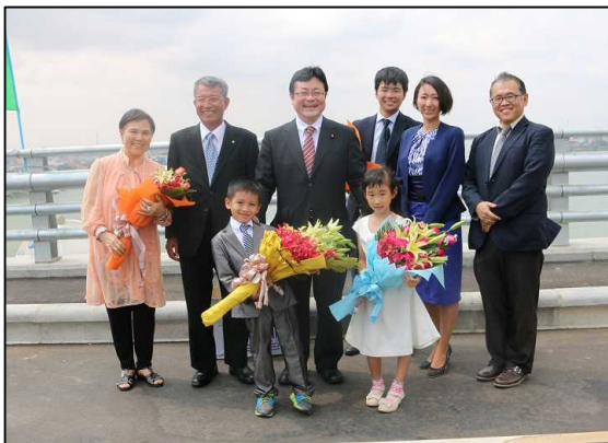
親子3代の渡り初めに参加した家族