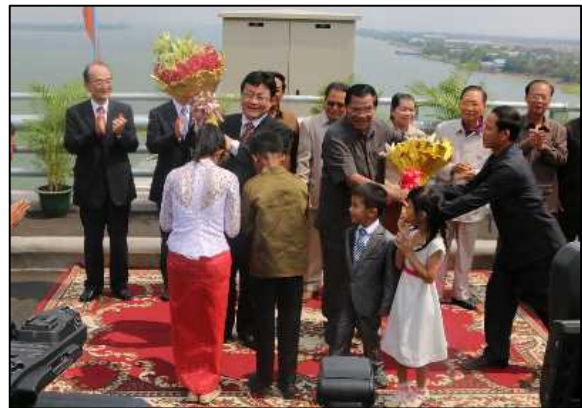
渡り初め参加者による花束贈呈