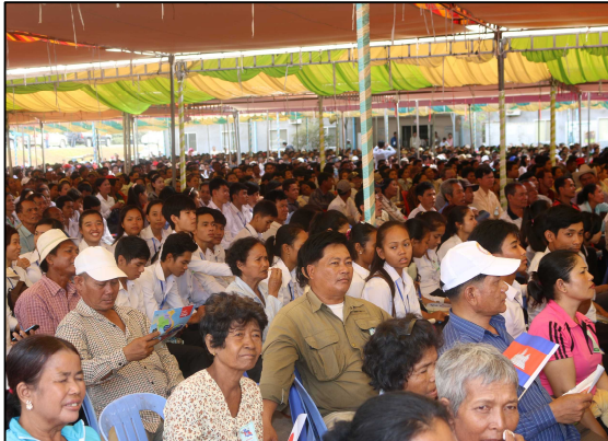
式典に参加する地元の方々