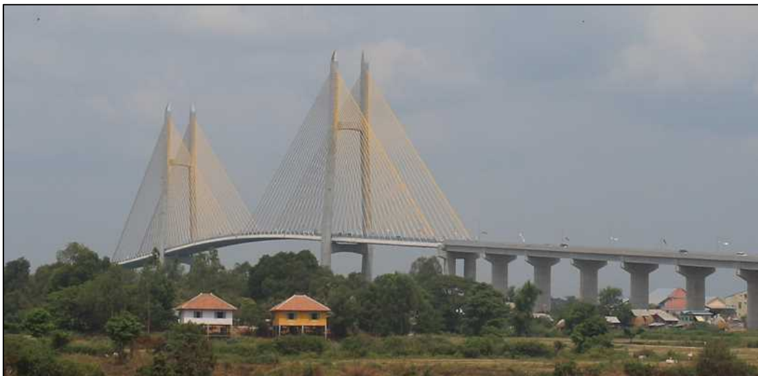
開通した「つばさ橋」

両者は、幅広い分野における協力を進めることにより、日本・カンボジアの「戦略的パートナーシップ」をさらに発展させていくことで一致しました。