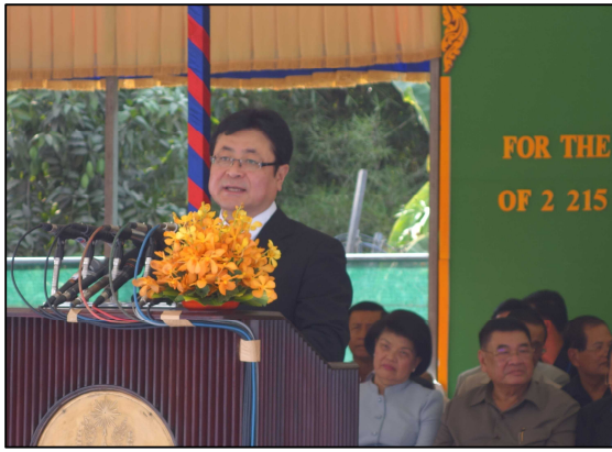
式典での西村副大臣挨拶