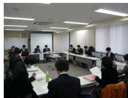
ブロック別勉強会の様子