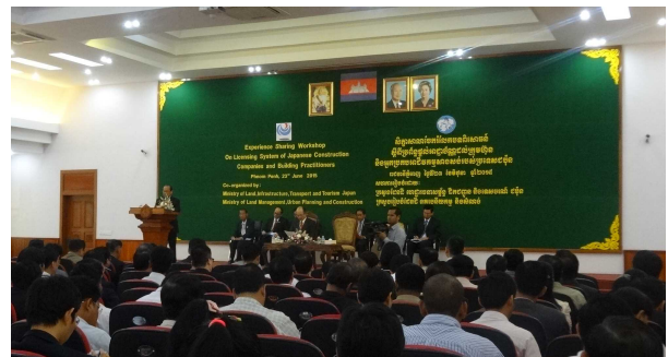
▲セミナー会場の様子