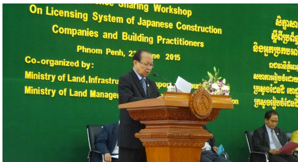
▲イム上級大臣による挨拶