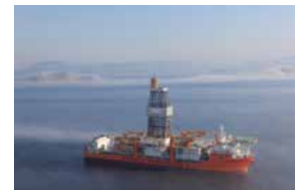
ドリルシップ： 日本郵船、川崎汽船、日本海洋掘削等が保有する ETESCO TAKATSUGU J。本船は、ブラジル沖で水深3,000mまでの大水深掘削を行う。