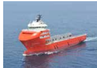
オフショア支援船 (ジャパン マリンユナイテッド建造)