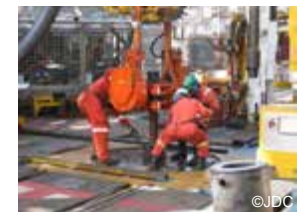
海洋構造物での オペレーション

国土交通省としては、2015年度から、産官学が連携した技術者育成システムの構築のための施策を展開しており、専門カリキュラムや教材の開発、座学による理解を補完するシミュレーションプログラムの開発、海外の大学・企業との連携体制の構築といった環境整備を行うこととしている。