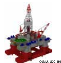
海洋構造物の設計