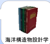
海洋構造物設計学