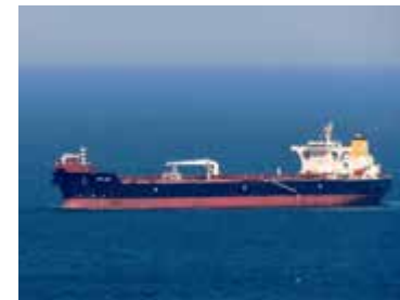
シャトルタンカー： 商船三井がViken MOL ASを通じて保有するSao Luiz。同社の船舶は、ブラジル沖で生産される原油のシャトル輸送業務に従事している。

まず、海運業界であるが、市況の変動が激しい一般海運と比較し、投資額が大きいものの、長期にわたり安定的な収入が見込まれることから、浮体式生産貯蔵積出設備 (FPSO)、シャトルタンカー、ドリルシップ等の海洋分野への参画を積極的に進めている。(株)商船三井は2014年9月、ノルウェーのViken Shipping ASと合弁会社Viken MOL ASを設立し、シャトルタンカー事業への新規参画を果たした。また、日本郵船(株)は以前からKnutsen NYK Offshore Tankers ASを通じてシャトルタンカー事業に参画していたが、2015年6月にブラジルでのシャトルタンカー定期用船契約を締結するなど着々と事業拡大を行っており、運航するシャトルタンカーは発注残を含め30隻以上となっている。FPSOの保有・用船事業についても、海運事業者の事業展開が続いており、(株)商船三井は、三井海洋開発(株)等とともに、2015年4月には新規の用船契約を締結した。日本郵船(株)も自らが参画するブラジルにおけるFPSOプロジェクトに自社の技術者を現地に派遣するなど、海洋分野におけるノウハウの蓄積を積極的に図っている。