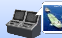
挙動再現シミュレーション システム