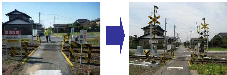
図19:踏切遮断機・警報機の整備