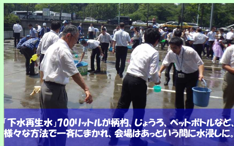
「下水再生水」700リットルが柄杓、じょうろ、ペットボトルなど、 様々な方法で一斉にまかれ、会場はあっという間に水浸しに。