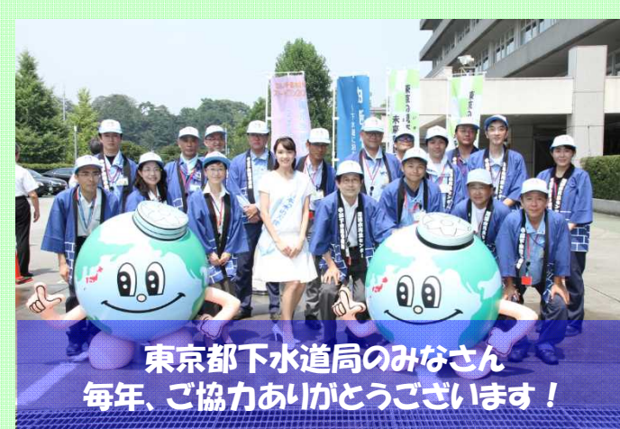
東京都下水道局のみなさん 毎年、ご協力ありがとうございます！