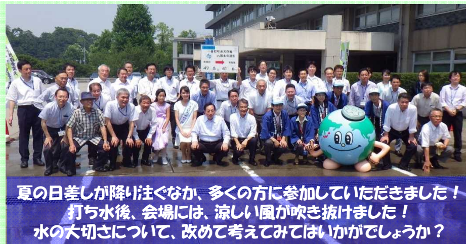
夏の日差しが降り注ぐなか、多くの方に参加していただきました！ 打ち水後、会場には、涼しい風が吹き抜けました！ 水の大切さについて、改めて考えてみてはいかがでしょうか？