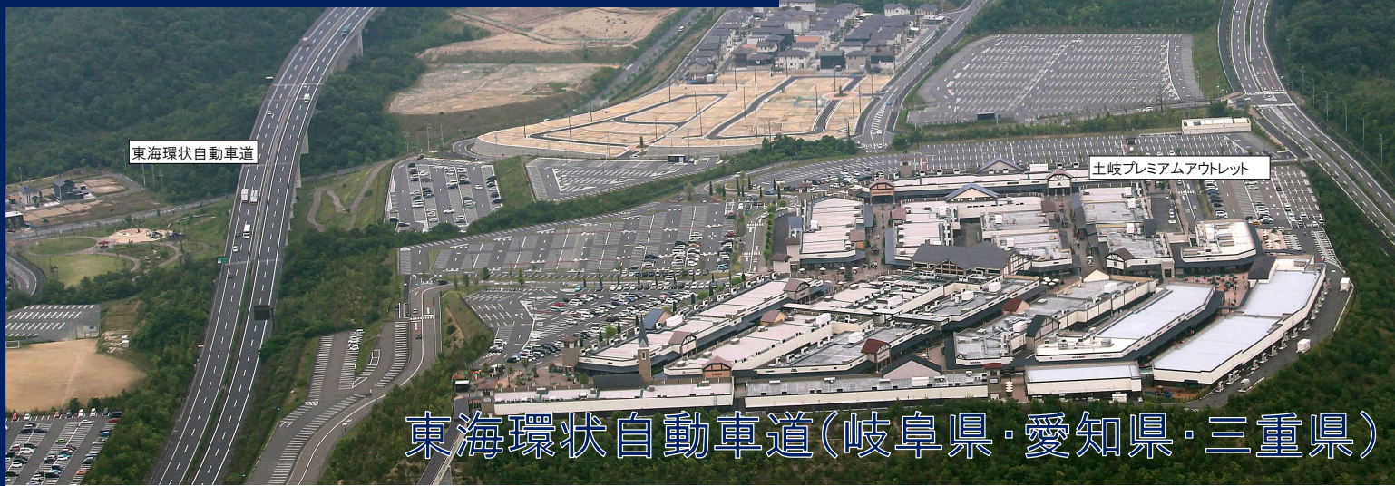
東海環状自動車道(岐阜県・愛知県・三重県)