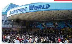
③アドベンチャーワールド