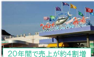
20年間で売上が約4割増