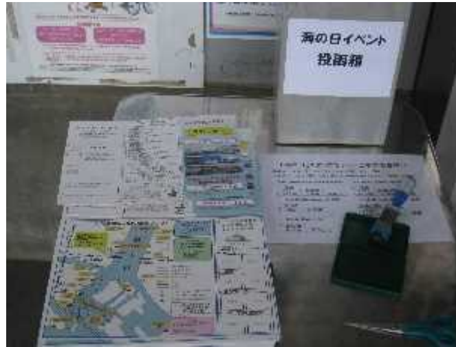
スタンプ置き場の様子①(浅草)