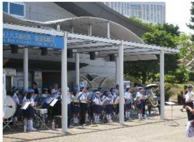
日本海洋少年団連盟音楽隊による演奏 (お台場海浜公園)