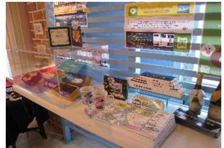
スタンプ置き場の様子③(日の出)