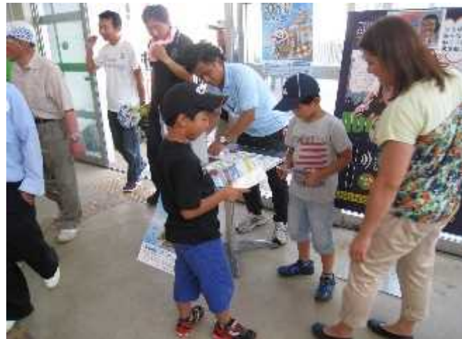
スタンプ置き場の様子②(日の出)