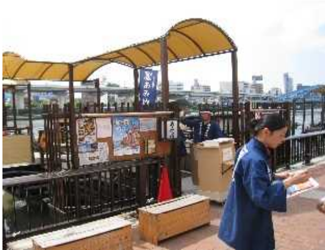
屋形船乗船時の様子