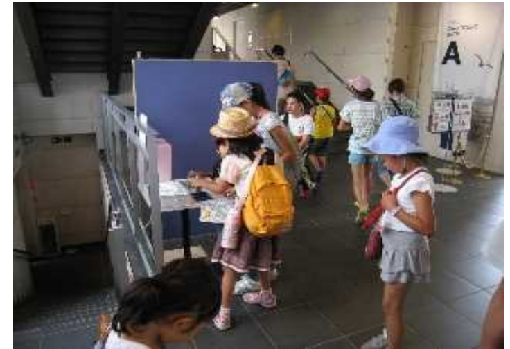
スタンプを押す来場者①(浅草)