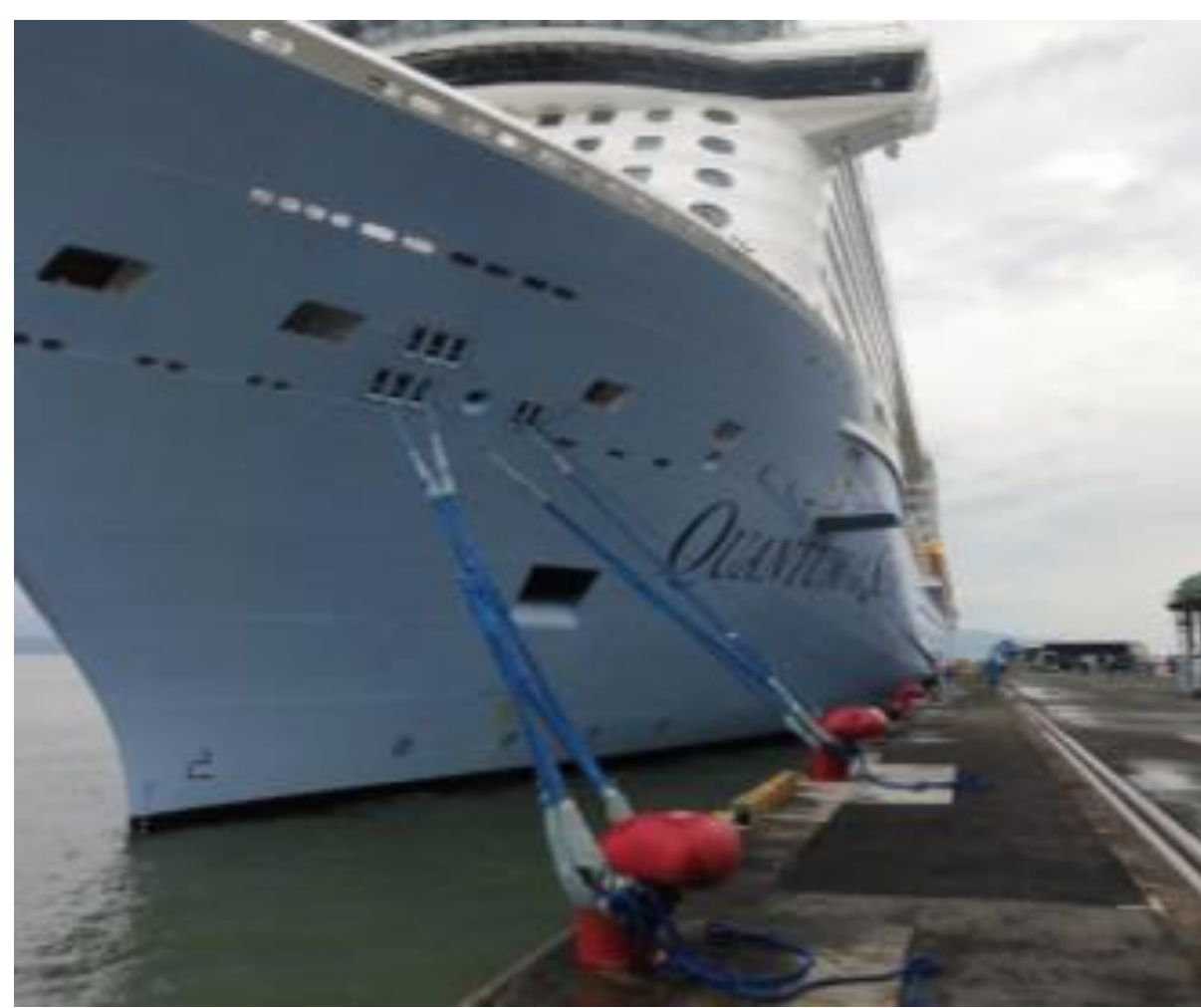
岸壁(改良後) 係船柱を追加