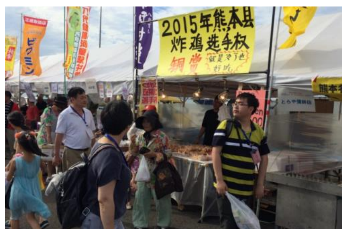
八代港ふ頭での物産市の状況(H27.7.23)