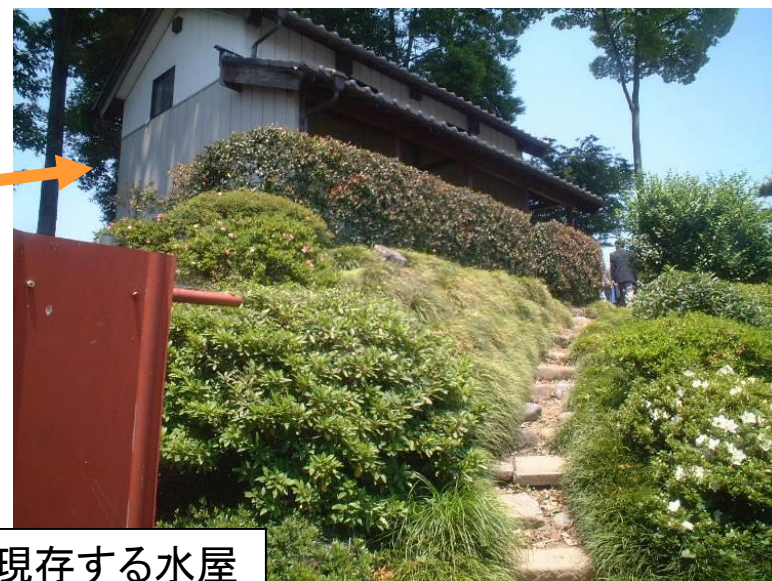
埼玉県加須市内に現存する水屋