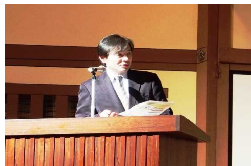
柳野公園緑地・景観課長の基調報告