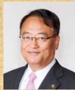
太宰府市長 芦刈 茂 氏