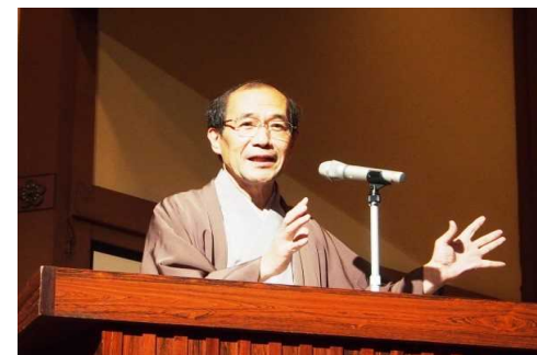
門川京都市長の発表