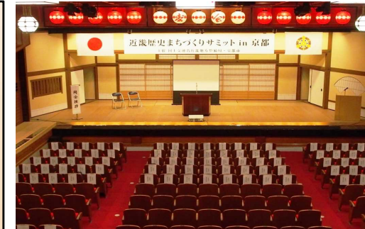
会場：上七軒歌舞練場