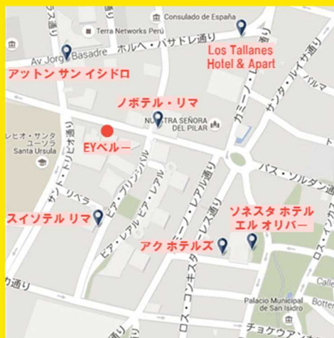
EY ペルー周辺ホテル

※Booking.comにてEYより徒歩5分以内の ホテル(四つ星以上)検索結果