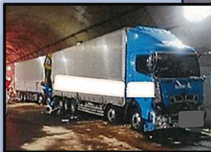
追突した大型トラック(左)と 相手車両1

この事故により、追突した大型トラックの運転者が重傷を負い、追突された大型トラック及びタンク車の運転者が軽傷を負った。