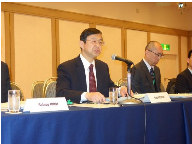
国土交通省池内技監による開会挨拶