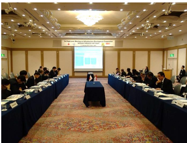
全体会合開催状況