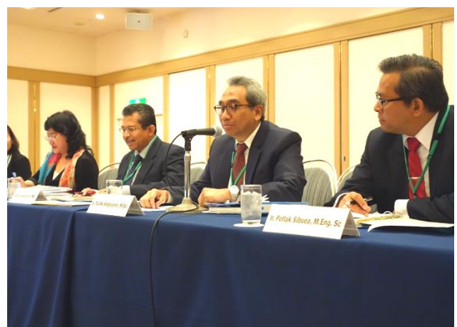
公共事業・国民住宅省トフィック次官による開会挨拶