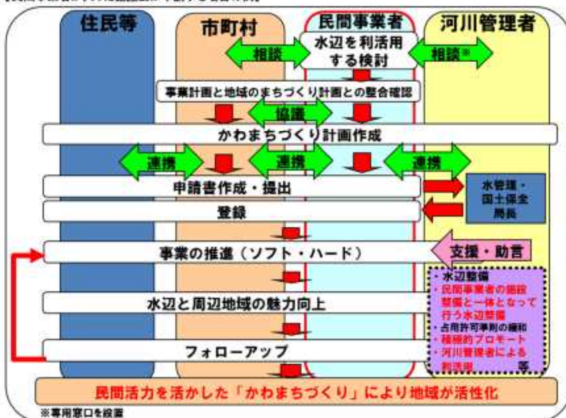
図：かわまちづくりの流れ