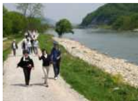
管理用通路をフットパスとして活用 (最上川)

ハード支援： 治水上及び河川利用上の安全・安心に係る河川管理施設の整備を通じ、まちづくりと一体となった水辺整備を支援。