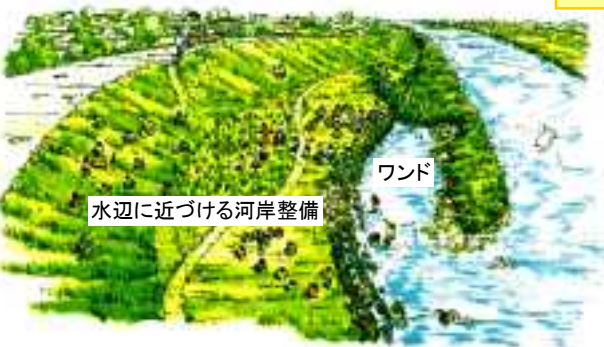
「水辺の楽校」のイメージ図