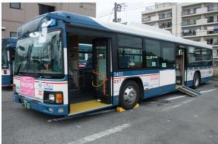
ノンステップバス

補助率：1／4又は補助対象経費と通常車両価格の差額の1／2のいずれか低い方（上限140万円）