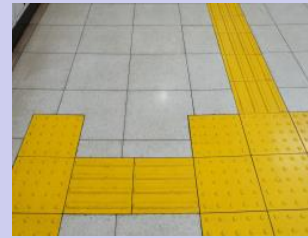
視覚障害者誘導用ブロック