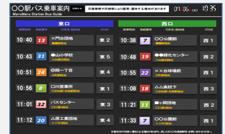
発車案内表示システム