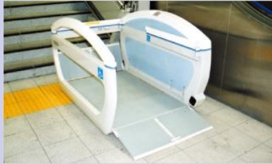
車椅子用階段昇降機