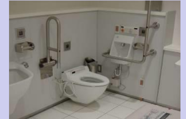
障害者対応型トイレ