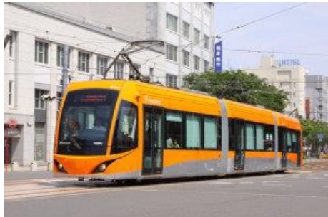
<低床式車両の導入>