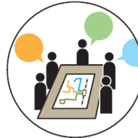
ワークショップの開催