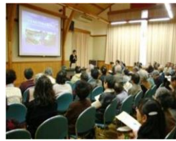
地域の検討会・説明会開催