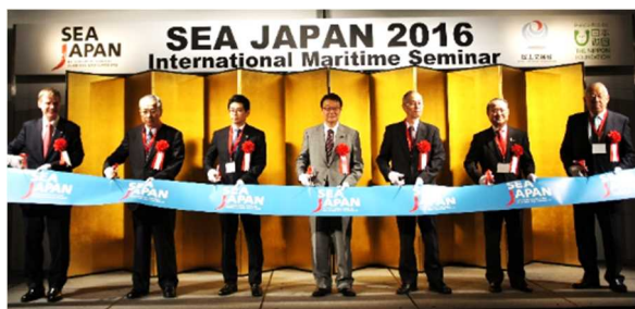
来賓によるテープカット