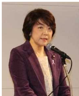
島尻海洋政策担当大臣による 特別講演