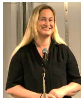
ノルウェー貿易産業漁業省 アイハン副大臣による基調講演