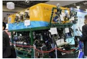
深海無人探査機 「かいこう 7000Ⅱ」ビークル