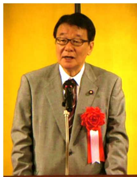
国土交通省 山本副大臣