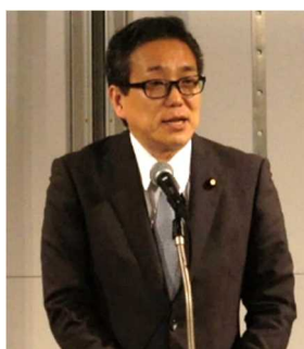
江島国土交通大臣政務官による 開会挨拶

http://www.mlit.go.jp/maritime/maritime_tk5_000044.html