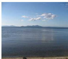
日本最大の湖。古代湖