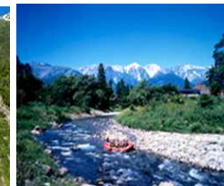
雄大な自然の中の川下り