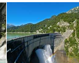
高さ186m。国内最大級のスケールと迫力