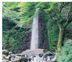
親孝行の伝説「養老孝子伝説」で有名