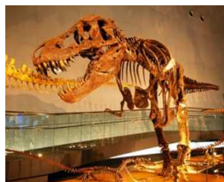
世界三大恐竜博物館の1つ