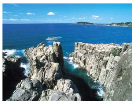
荒々しい岩肌の柱状節理