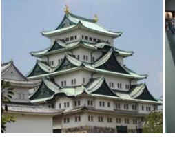
金のシャチホコ。武将隊お出迎え