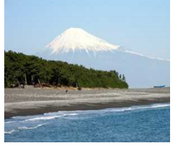
日本の象徴。3776m 世界文化遺産