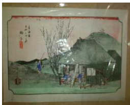
浮世絵師歌川広重の作品を中心にコレクションされた美術館