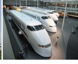
JR東海の鉄道ミュージアム