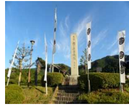
天下分け目の戦いの地