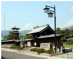
関ヶ原古戦場(岐阜県不破郡)