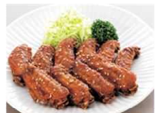
なごやめし(手羽先)