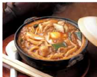
なごやめし(味噌煮込みうどん)