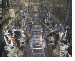
トヨタ自動車の生産ライン