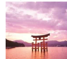
世界遺産。トリップアドバイザーで外国人に人気のスポット第3位