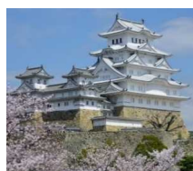
世界遺産。平成の大修理を終え、ますます美しい姫路城