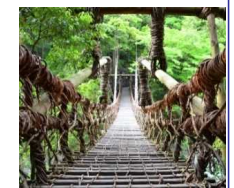
美しい日本の原風景(かざら橋や茅葺屋根など)が残る祖谷。