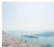
瀬戸内の美しい自然景観を各地で楽しめる