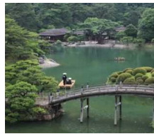
ミシュランミツ星に格付け。日本を代表する大名庭園として国内外に有名