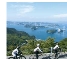
CNNIにより世界7大サイクリングコースにも選ばれたしまなみ海道。車またはサイクリングでの移動も可。