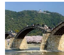
日本三名橋の一つにも数えられている錦帯橋。日本の匠ともいえる美しい構造