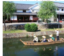
白壁の美しい町並みが残る倉敷。交通の大動脈であった瀬戸内の文化・歴史が感じられる