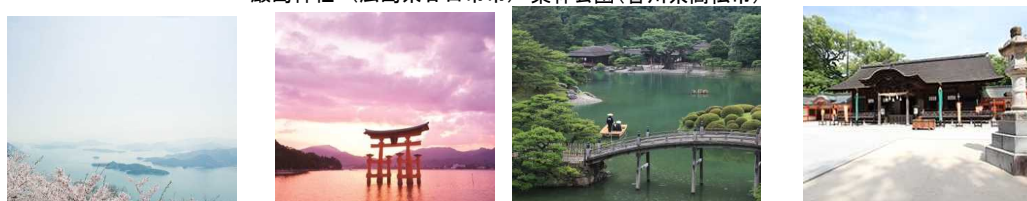
瀬戸内の美しい自然景観を各地で楽しめる 世界遺産。トリップアドバイザーで外国人に人気のスポット第3位 ミシュラン三ツ星に格付け。日本を代表する大名庭園として国内外に有名 全国で国宝を始め重要文化財に指定されている武具や甲冑類のうち8割が収蔵されているといわれている