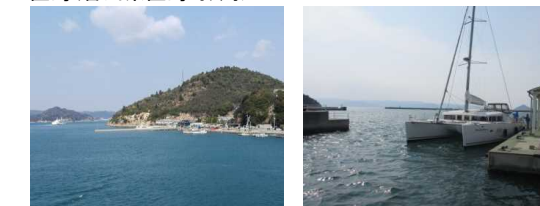
現代アートの聖地として有名な直島。海外からの注目も高い。犬島など周辺の島々にも多くのアート作品がある