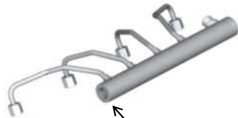
基準不適合箇所 燃料高压レール