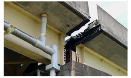
桁のずれ(開き 約30~40cm) ⇒橋梁を支える設備の設置作業中