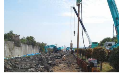
盛土の復旧工事实施中