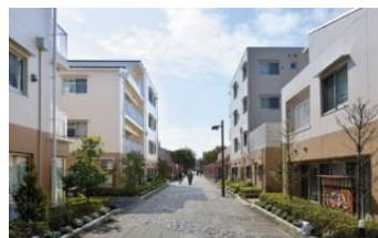
団地を再生した 高齢者向け住宅