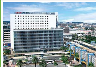
未利用の公有地を活用 した拠点施設整備