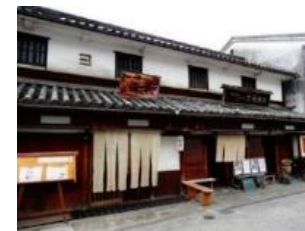
クラウドファンディングを活用した古民家改装