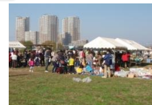
協定に基づく空き地等 の暫定的な一般利用