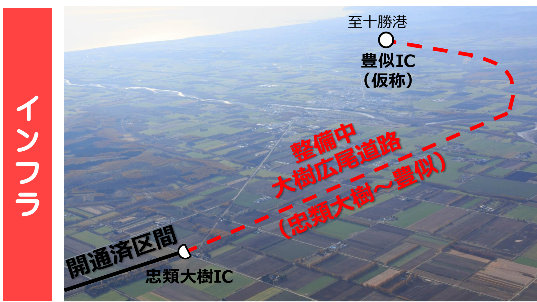
整備中(大樹広尾道路)