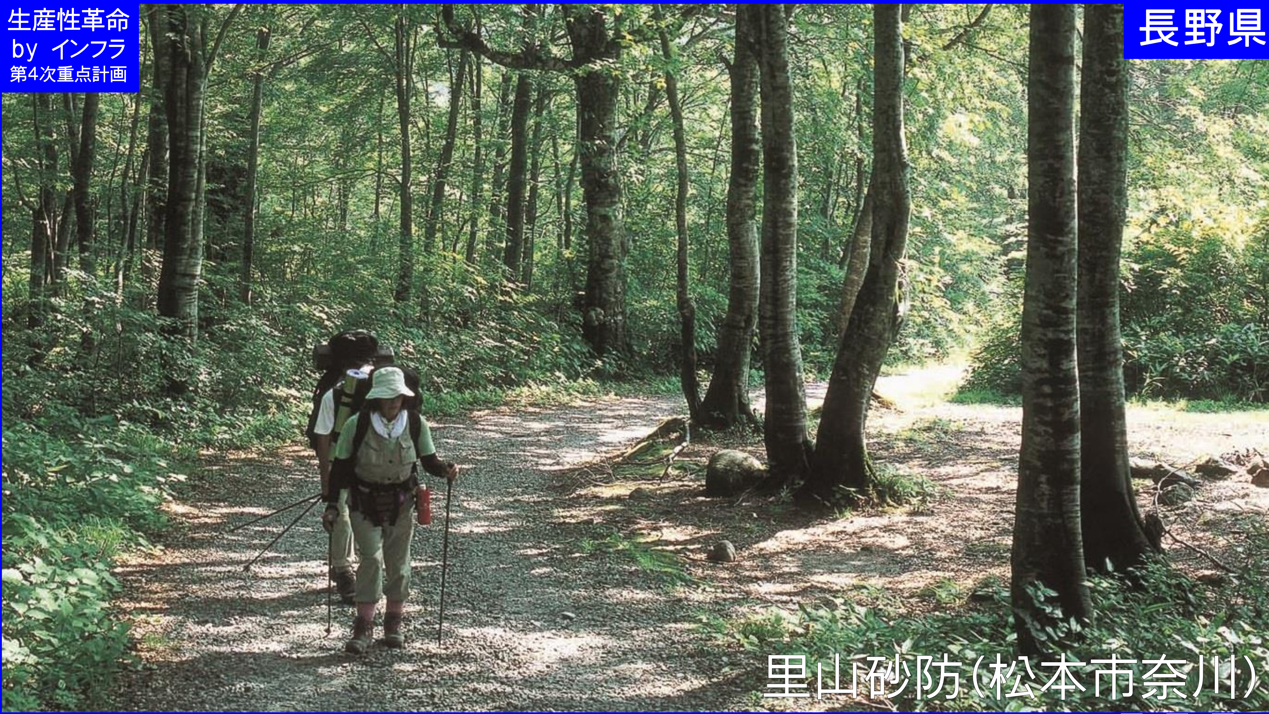
里山砂防(松本市奈川)