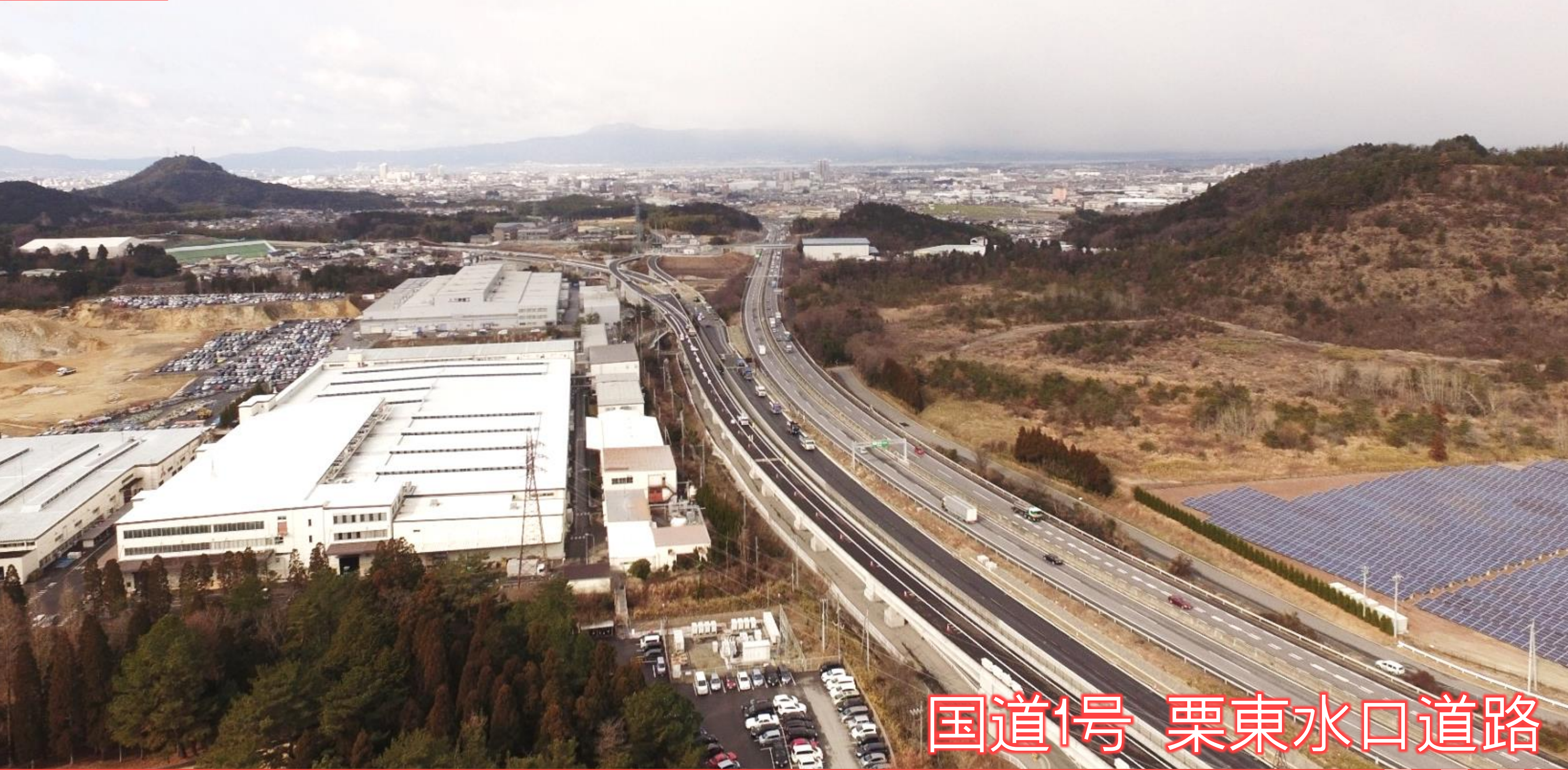
国道1号 栗東水口道路