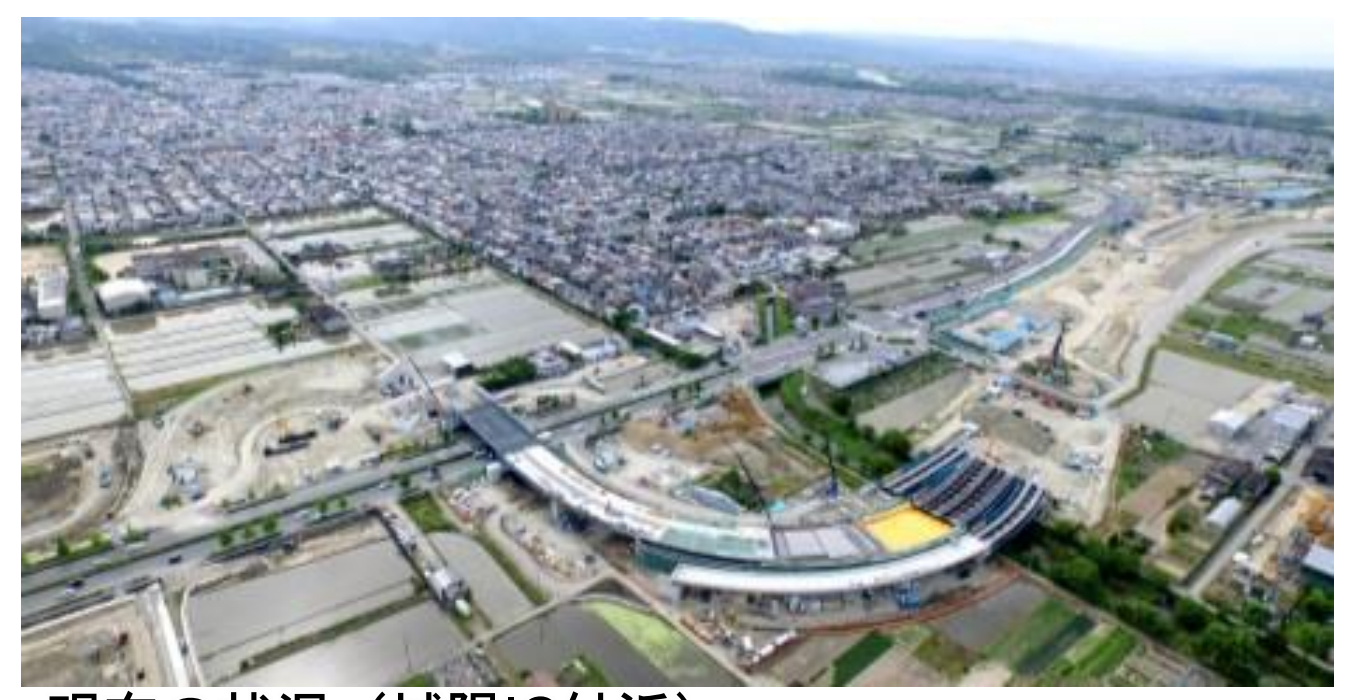
現在の状況（城陽IC付近）