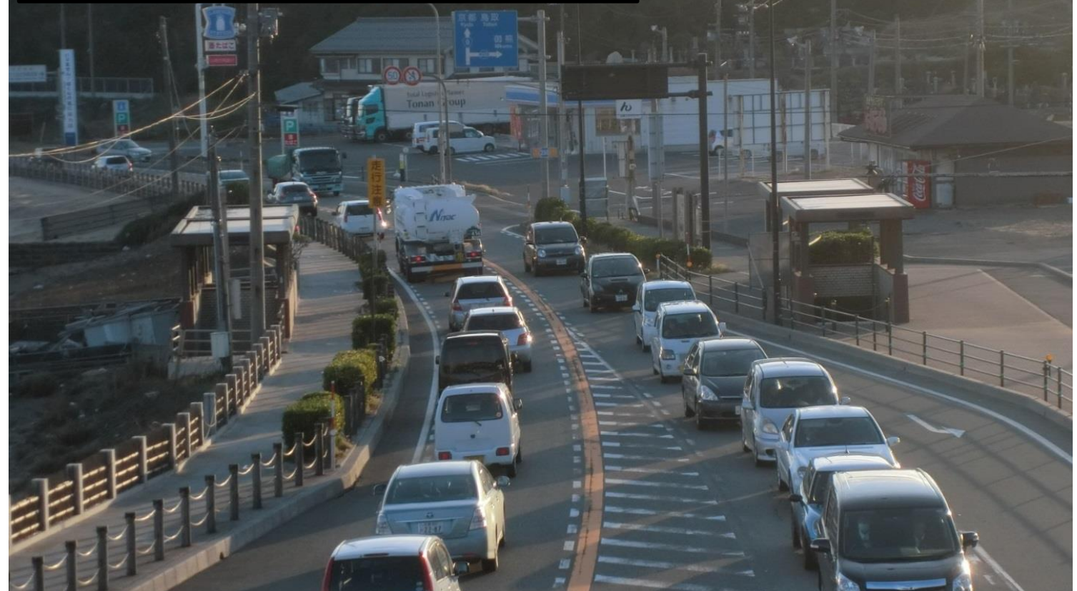
渋滞する国道9号の現道