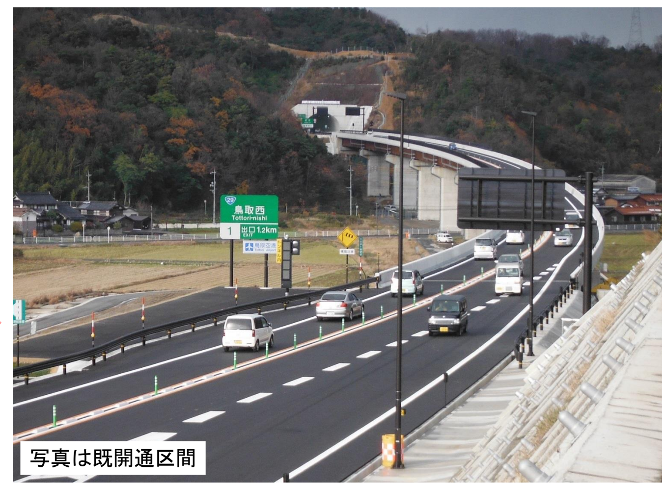
写真は既開通区間