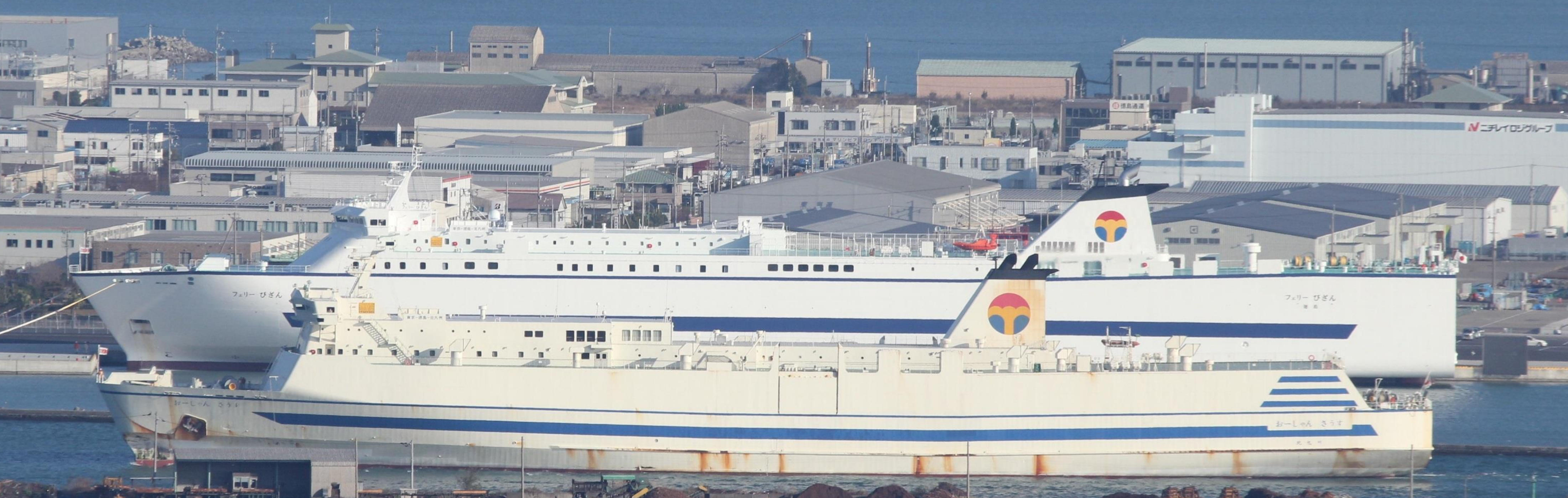
既存フェリー(手前)と新造フェリー(奥)