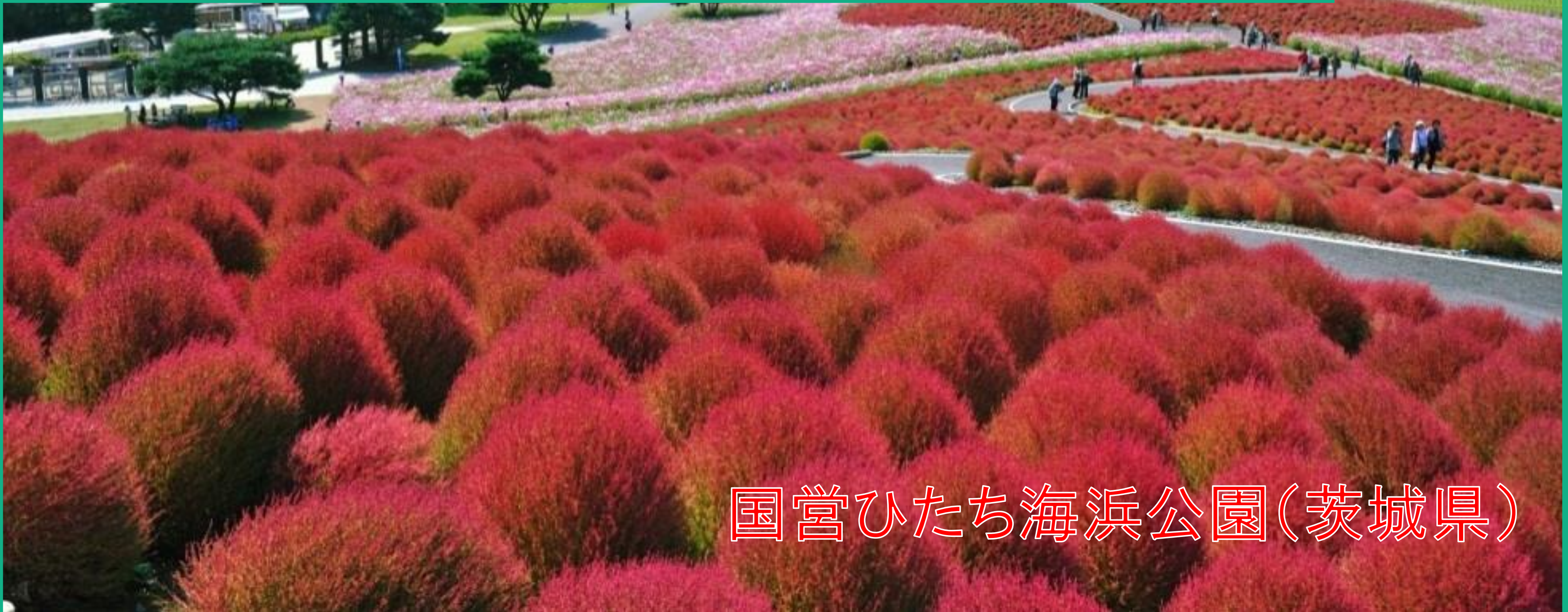
国営ひたち海浜公園(茨城県)