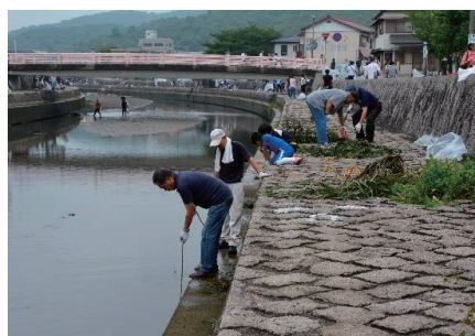
勢田川七夕大そうじ