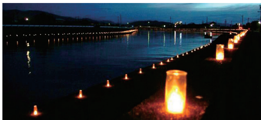
勢田川を天の川に～キャンドルナイト伊勢～