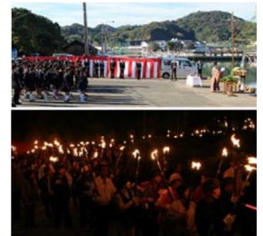
【津浪祭(上)、稲むらの火祭り(下)】

重要文化財「広八幡神社」、「濱口家住宅」等と、稲むらの火の伝承活動や広八幡神社の祭礼、熊野古道等からなる歴史的風致の維持向上を図るため、広村堤防歴史広場や熊野古道の整備、稲むらの火関連事業（濱口梧陵生誕200年祭等）などが位置づけられています。