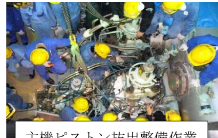
主機ピストン抜出整備作業