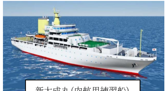
新大成丸(内航用練習船)

ハード（新大成丸）及びソフト（内航船員養成教育訓練プログラム）の運用・整備により、単独で業務を担える能力の養成を図った。