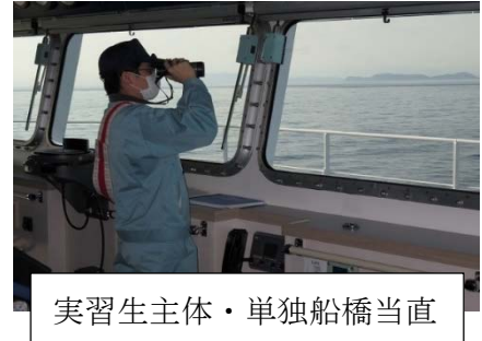
実習生主体・単独船橋当直