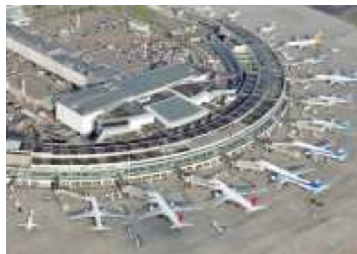
複数空港の一体運営（新千歳）