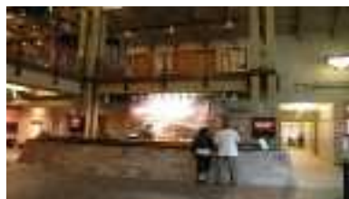
ビジターセンターでの旅行案内