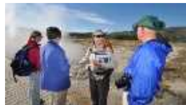
専門家によるガイドツアー