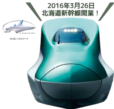
2016年3月26日 北海道新幹線開業！

「ジャパン・レールパス」を訪日後でも購入可能化。 また、新幹線開業やコンセッション空港運営等と連動した、観光地へのアクセス交通の充実を実現。