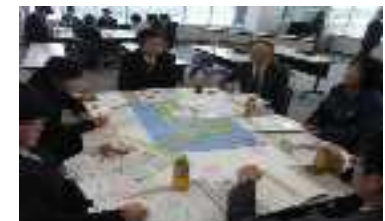
地域協議会の様子