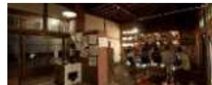
廃業した旅館や飲食店舗をリノベーション