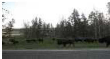
野生動物を間近で観察

観光客が豊かな自然を体験するための施設やプログラムを提供。運営費の一部は、入場料やコンセッション料で充当。