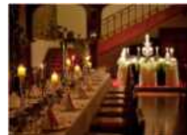
結婚式場等への活用 (西日本工業倶楽部会館)