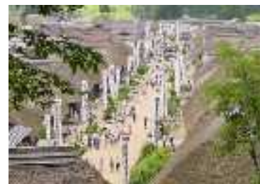
観光拠点の面的整備 (福島県大内宿の茅葺き民家群)

2020年までに、文化財を核とする観光拠点を 全国で200整備、わかりやすい多言語解説など 1000事業を展開し、集中的に支援強化。