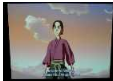
わかりやすい多言語解説 (日光東照宮新宝物館)