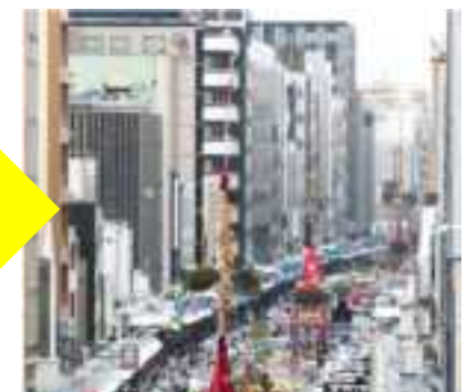
屋外広告物の適正化が進んだ四条大通 (2007年 → 2015年)