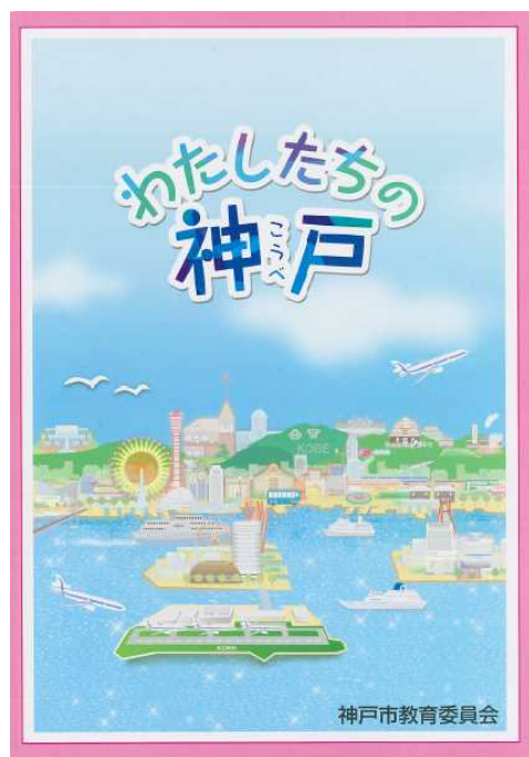
小学校社会科 副読本