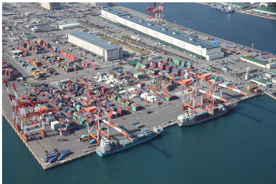
コンテナターミナル(PC18)