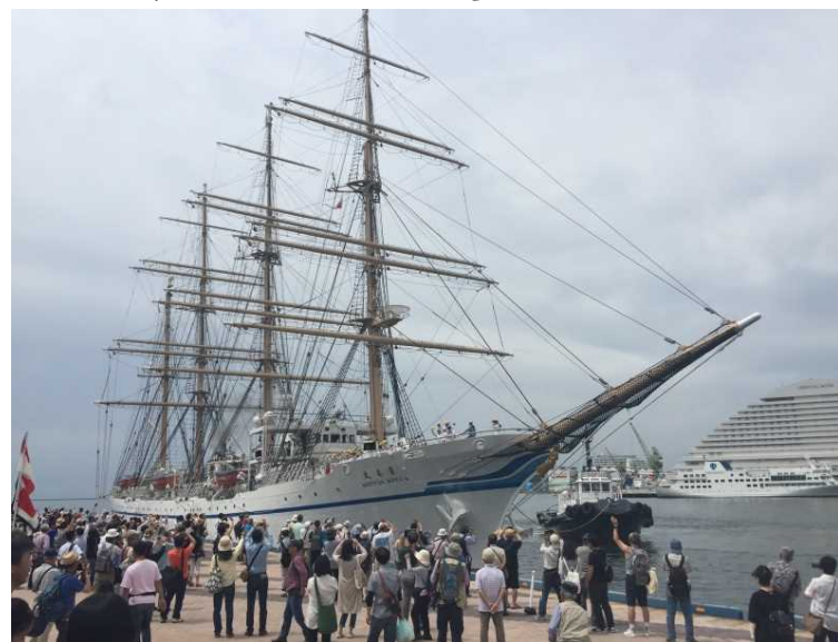
練習船「日本丸」出港歓送セレモニー