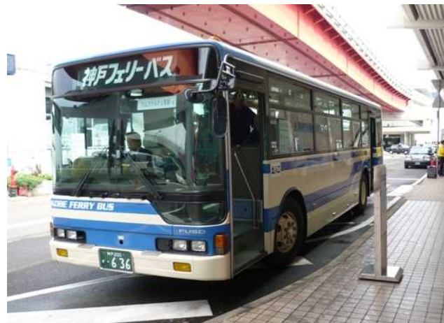
都心商業地（元町・三宮）まで、 無料シャトルバスを運行