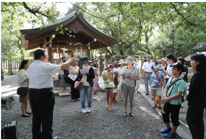
「歴史」探訪ツアー ～神戸港開港の昔と今の違いを探訪しよう～