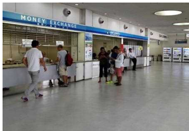
臨時観光案内所・外貨両替 通訳・案内ボランティア KOBE Free Wi-Fiご案内