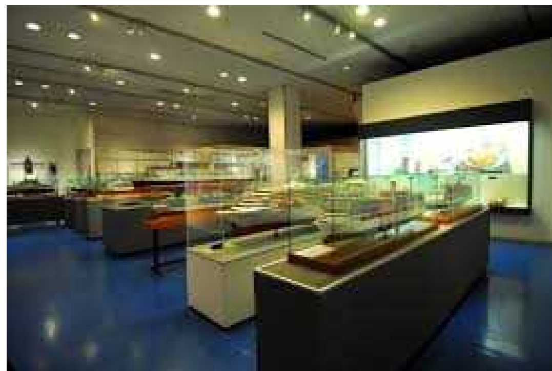
＜神戸海洋博物館 館内＞