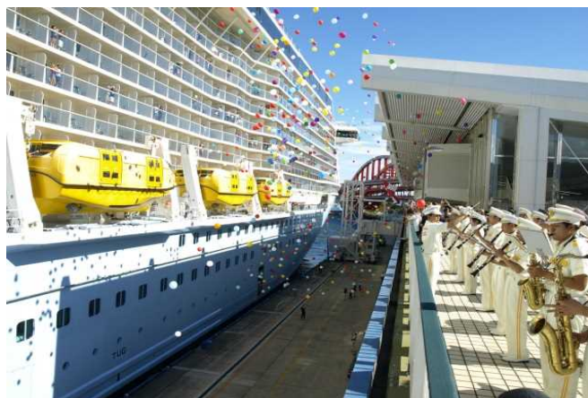
バルーンリリースと 消防音楽隊による歓迎演奏