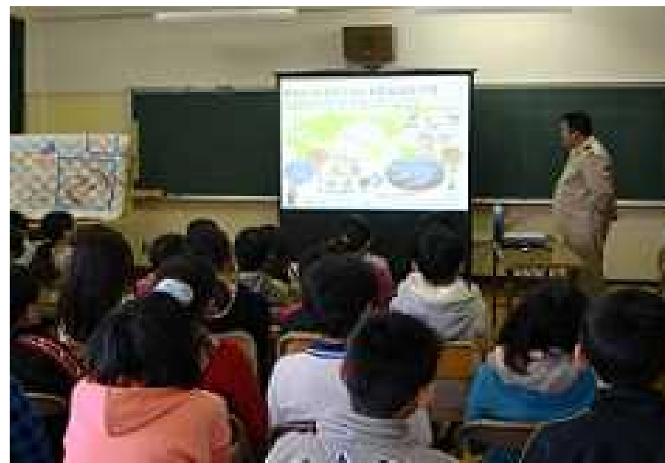
海の出前授業 (神戸市立塩屋北小学校 H27.1 1.26)