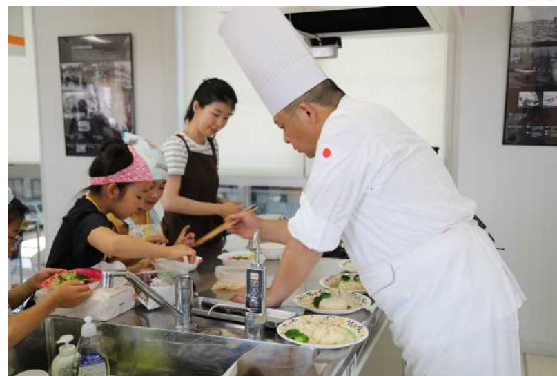
「ご馳走」体験ツアー ～神戸港発祥の食文化を学んで学習しよう