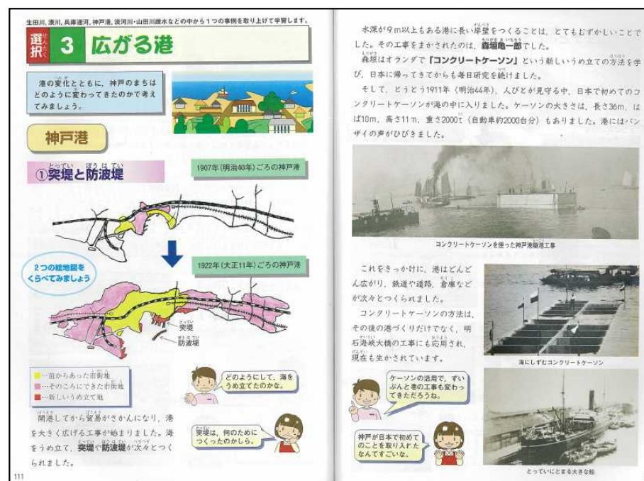
小学校社会科 副読本 神戸港ページ