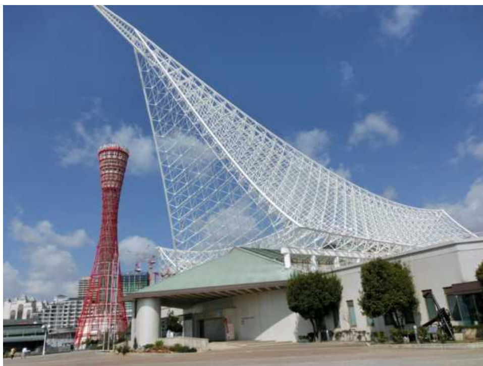
＜神戸海洋博物館外観＞