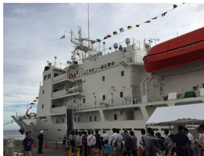
テクノオーシャン2016 よこすか・しんかい6500等の見学会