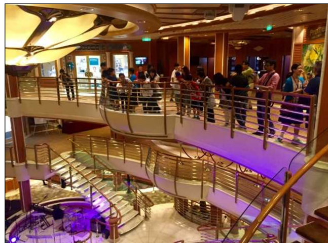
H28.5.29 ゴールデンプリンセス船内見学会