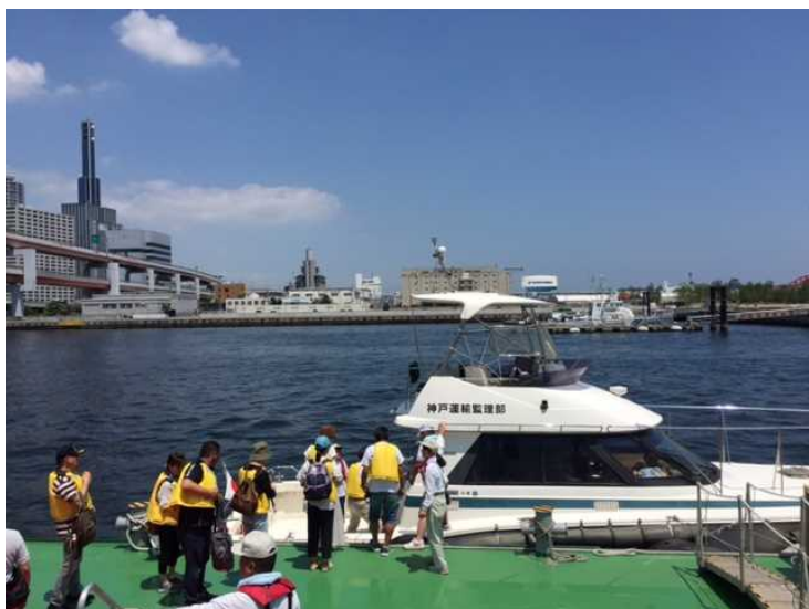
神戸港ポート天国