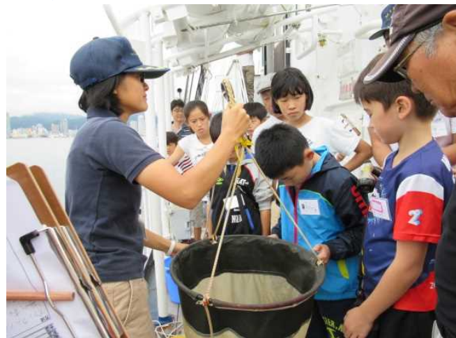
H28.10.1 みらいへ体験航海