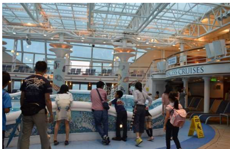
H28.5.29 ゴールデンプリンセス船内見学会