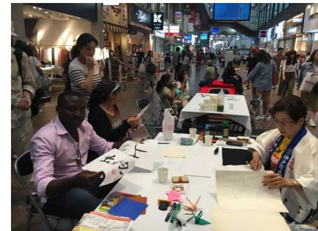
都心商業地でのおもてなし (観光案内、書道体験、抹茶試飲等)