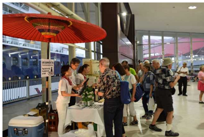
ターミナルでのおもてなし (日本酒の試飲)