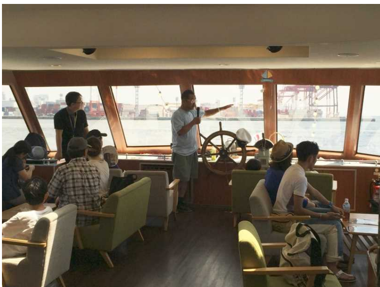
神戸クルーズ体験