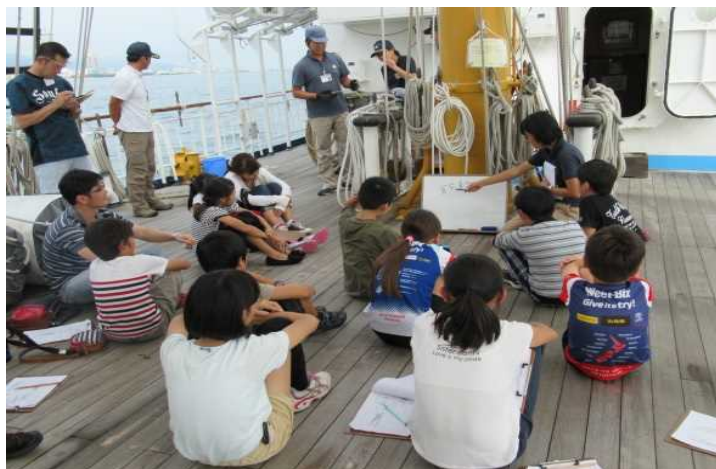
H28.10.1 みらいへ体験航海