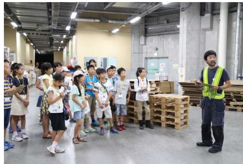
「物流」体験ツアー ～物流現場を見学し、港を学ぼう～