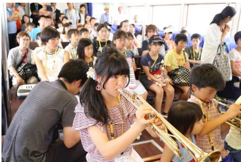
「音楽」体験ツアー ～明日へ輝け、みんなのJAZZステージ～