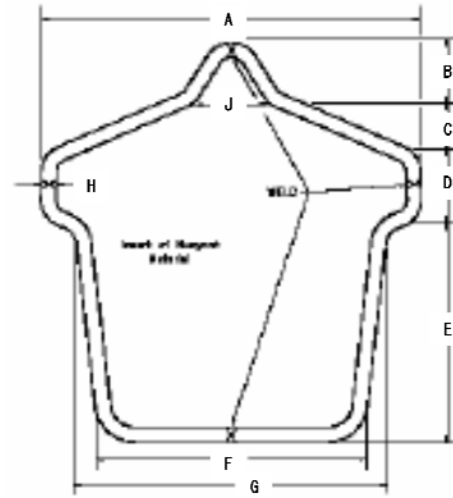
図2 垂直強度試験用型